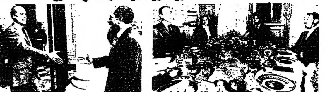
الرئيسان السادات وديستان في مدينة الفسلف التي اقامها الرئيس الفرنسي امس كترية للرئيس المصري. ويبدو كذلك نجل الرئيس الفرنسي لويس وكترية الرئيس المصري جيهان التي تعجل نفس اسمها.

هذا الرئيس انور السادات وديستان امس محادثته في باريس مع الرئيس الفلبي جيسكار ديستان، وقال انه يتفق مع الفلسطينيين في مؤتمر جنيف. وقال انه يتفق مع الفلسطينيين في مؤتمر جنيف. وقال انه يتفق مع الفلسطينيين في مؤتمر جنيف. وقال انه يتفق مع الفلسطينيين في مؤتمر جنيف.